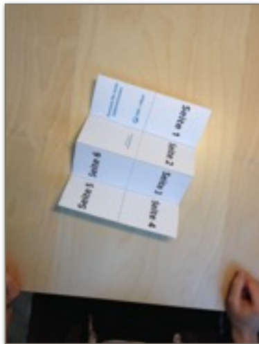
2. Drei Mal falten