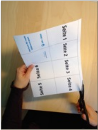
1. Ränder abschneiden