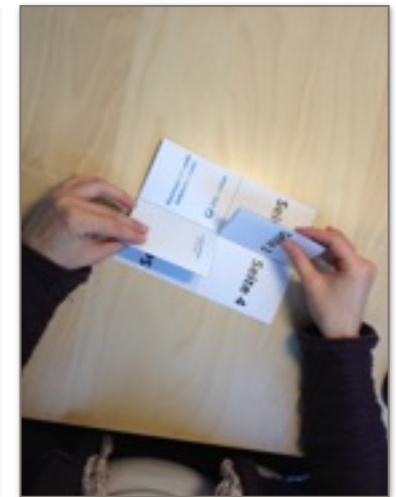
5. Zur Seite falten