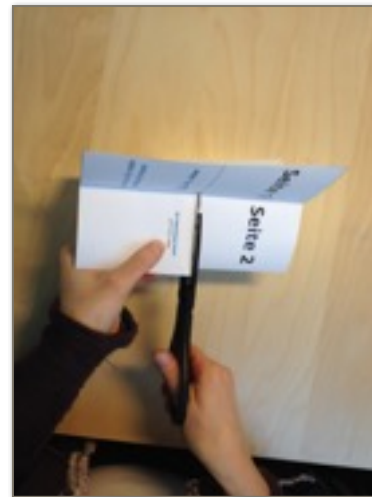
3. Gestrichelte Linie schneiden