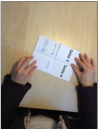
6. So sieht `s aus