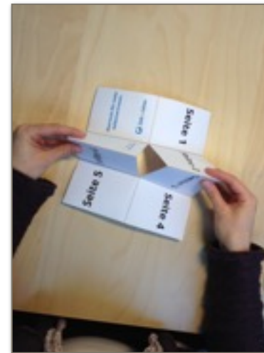
4. So sieht `s aus